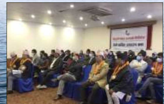
तेस्रो वार्षिक साधारण सभामा प्रगति विवरण प्रस्तुत हुँदै ।