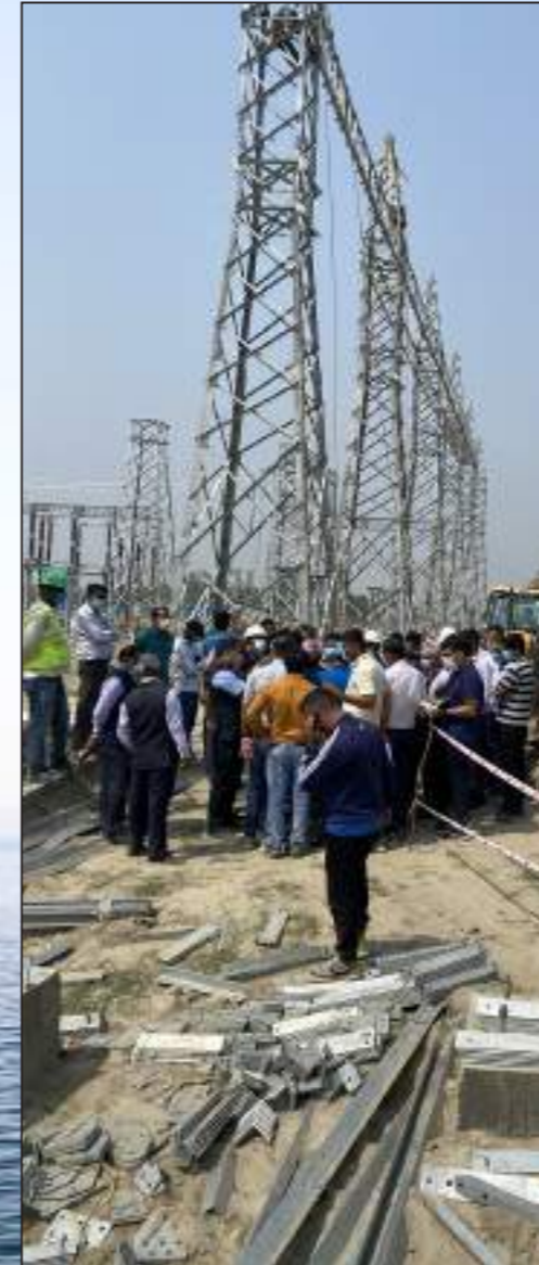
दुहवीमा निर्माणार्थिन २२० केभिए प्रसारण लाइनको स्थलगत अनुगमनमा प्रवन्ध सञ्चालकको सहभागिता ।