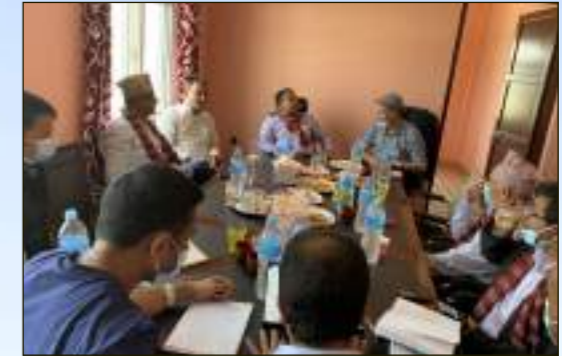
२२० केभिए ट्रान्समिसन लाइनको निर्माण सम्पन्न गर्ने कार्यको लागि नेविप्रा दुहवीमा भएको बैठक ।