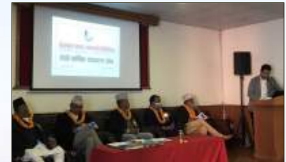
तेस्रो वार्षिक साधारण सभाको सञ्चालन ।